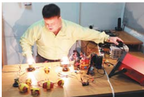
Установка в работе. На переднем плане различные (по обмоткам и зазорам) варианты трансгенераторов магнитного поля

тип резонансного преобразователя импульсов постоянного тока в переменный гораздо проще, дешевле и эффективнее инверторов переменного тока. Новое поколение мощных и быстрых запираемых тиристоров позволяет легко коммутировать, не хуже транзисторов, мощности в десятки мегаватт, и это не предел. Это значит, что обратный преобразователь можно легко сделать и на электротехнической или трансформаторной стали на большие мощности — в несколько мегаватт и более. Предела