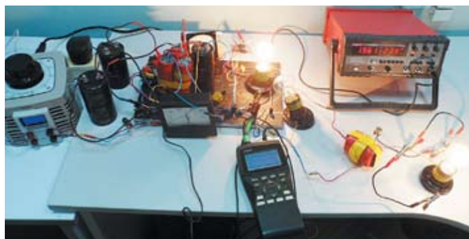
На фото хорошо видно, что обе лампочки горят практически одинаково. При этом в эксперименте: входная потребляемая мощность по постоянному току 135 — 140 Вт (из них на потери примерно 20 — 25%), а полезная мощность на двух лампах превышает 200 Вт. Итого полезная мощность плюс потери превышают 230 — 235 Вт при входе 135 — 140 Вт

Вторичное магнитное поле можно использовать в различных режимах работы как в статических устройствах, так и в электрических машинах вращения типа синхронного или индукторного генератора, но с эффектом разделения магнитных полей индуктора (или ротора индуктора) и статора. Вторичное магнитное поле стали статора не тормозит ротор-индуктор, но при этом даёт электроэнергию (об этом было в прошлых статьях). Но технически преобразование магнитной энергии вторичного поля наиболее удобно производить в статических устройствах (в цикле намагничивание — размагничивание) при фазе размагничивания в режиме так называемого обратного хода. Эксперименты, кстати, отлично подтверждают